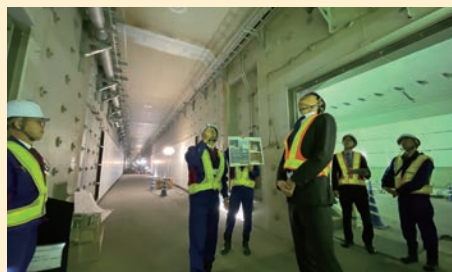
完成前の「海の森トンネル」を 視察