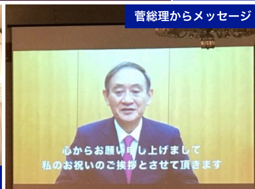
菅総理からメッセージ