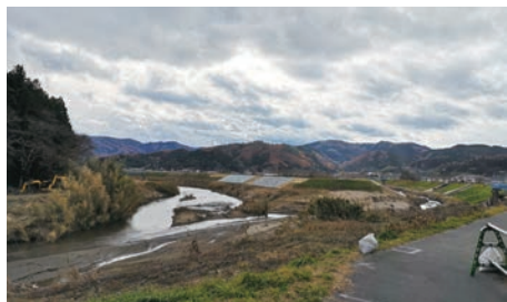
台風19号の被害を受けた 福島宮城を視察