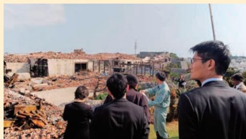
首里城火災跡を視察