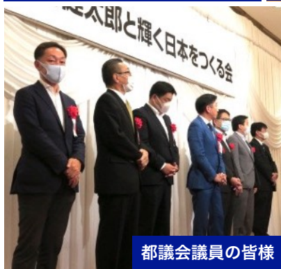
都議会議員の皆様