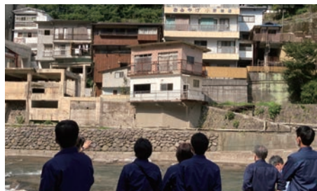
福岡・大分・熊本豪雨被害を視察