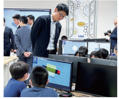
次世代のテクノロジー活用人材の育成現場を視察