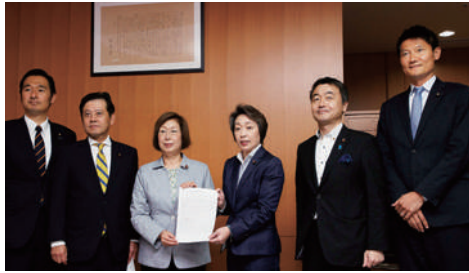
永岡桂子文部科学大臣に申し入れ