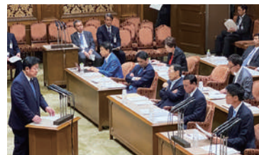
西村明宏環境大臣にG7広島サミットの総括を質問