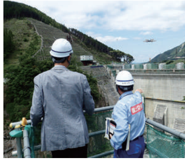
「熊本地震」被災地の復旧・復興状況を視察