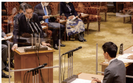
参議院予算委員会で岸田文雄総理に大規模災害の対応や生徒たちのスポーツ環境の整備、コロナ後の観光振興策について質問