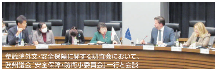
参議院外交・安全保障に関する調査会において、欧州議会「安全保障・防衛小委員会」一行と会談