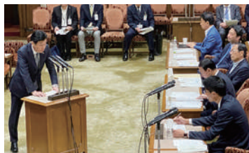
西村康稔経済産業大臣に再生可能エネルギーについて質問