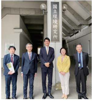
地球温暖化対策や海洋プラスチックなどの研究内容や動向をお伺いするために、国立環境研究所を訪問